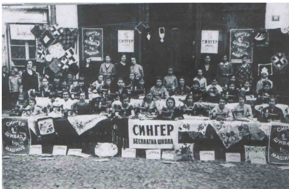
Прилог бр. 2: Кројачки курс за девојке из Лесковца.