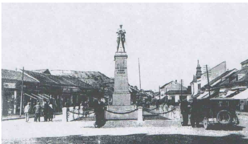
Прилог бр. 4: Лесковац, Главна пијаца.