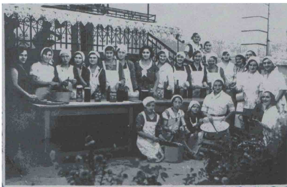
Прилог бр. 3: Домаћички курс за девојке из Лесковца, 1932. године.