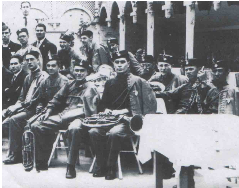
Оркестар Соколског дома у башти хотела „Костић“.

Народни универзитет је посебна просветна установа основана у Лесковцу на иницијативу Савеза земљорадничких задруга са седиштем у Лесковцу. Предавања која су одржавана на Универзитету обухватала су задругарство, народно просвећивање, пољопривреду, хигијену и увек су добро прихватана. 5 Отварање Народног универзитета у Лесковцу извршено је у недељу 13. јануара 1924. године у сали Реалке. 6 Иако је 1928. године добио чврсту организацију и активно одржавао предавања, Народни универзитет није унео нови квалитет у културни живот Лесковца.