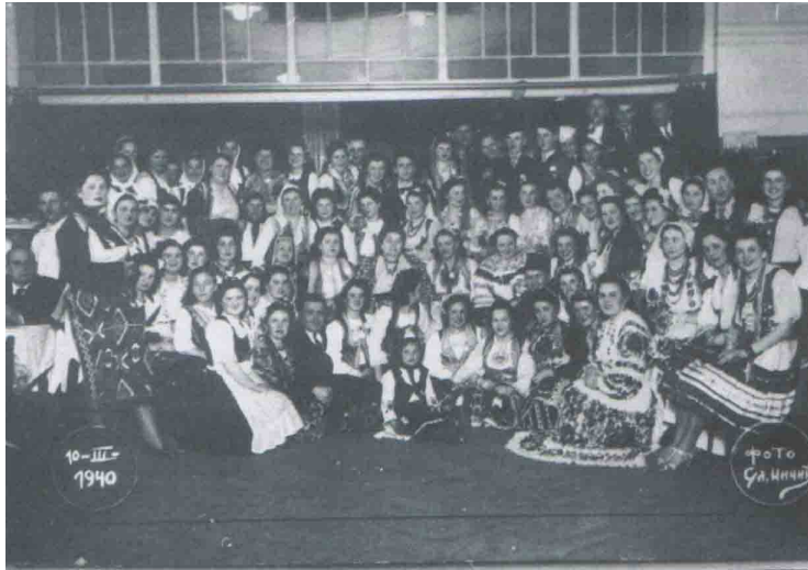
Славље Женске подружине 10. марта 1940. године.