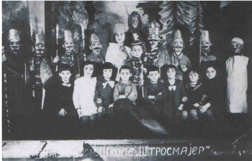
Позориште Основне школе „Штросмајер“, Лесковац, 1933. године.