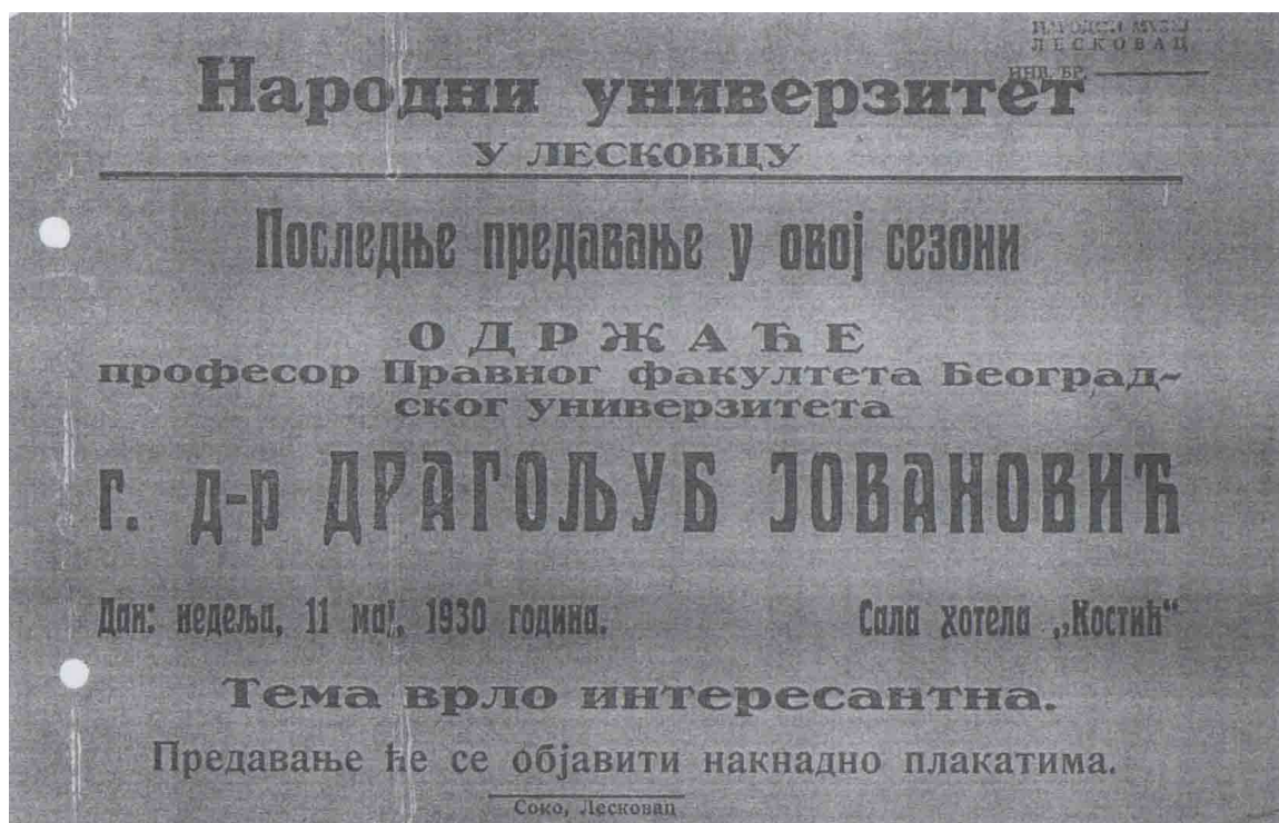
Прилог бр. 7: Позивница за предавање Народног универзитета у Лесковцу, 1930. година.