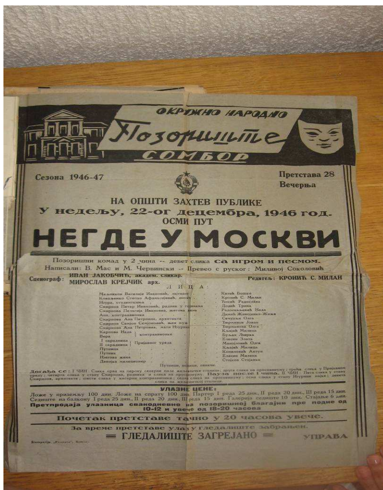
Фотографија:1. Плакат за представу „Негде у Москви“