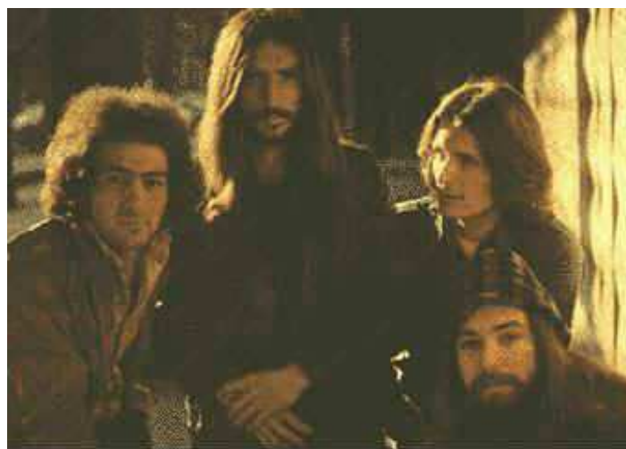
Фотографија 1- Смаковци испред зграде Политике у Београду 1974.