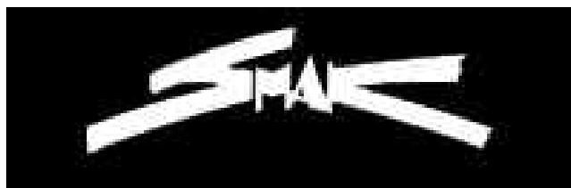
Лого групе Смак