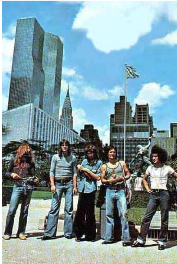
Смак у посети Њујорку, лето 1976.